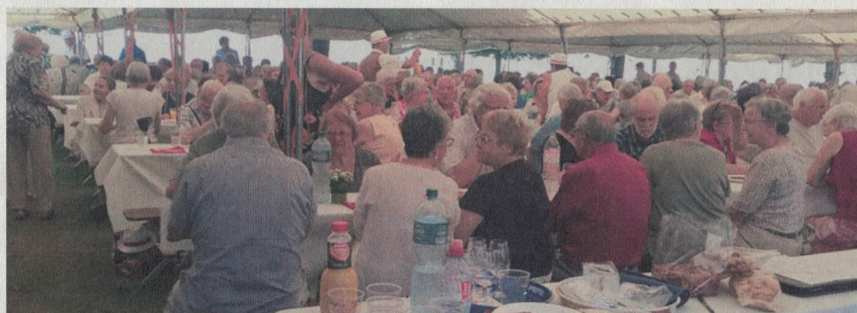
Le premier repas des aînés de juin 2019 à Chez-le-Bart.