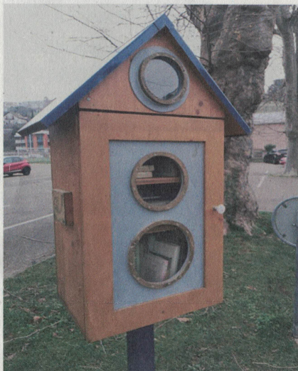
La boîte à livres du port, réalisée par les élèves du Centre scolaire des Cerisiers.